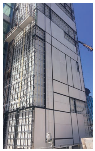
פרויקט BMW בביצוע, ישר אדריכלים