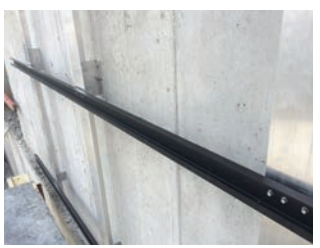
קיבוע פרופיל אופקי