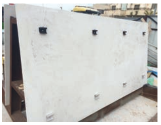
פריסת מתלים בגב האריח