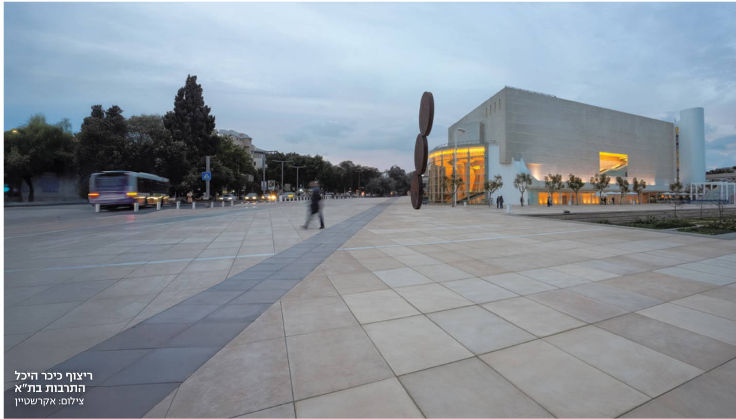
ריצוף כיכר היכל התרבות בת"א