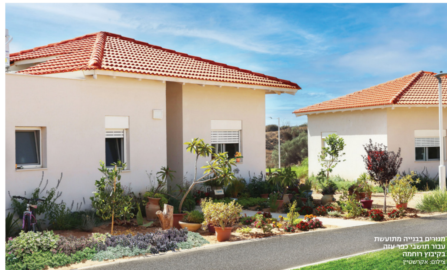
מגורים בבנייה מתועשת עבור תושבי כפר עזה בקיבוץ רוחמה

← את כל מוצרי הכטון הנדרשים. הקמת המפעלים בפריפריה לא היתה רק הודמנות להתרחבות הח" ברה, כי אם גם שליחות ומשימה לאומית, והיום אני גאה שהחברה שלנו מייצרת מקומות תעסוקה באזורים הללו".