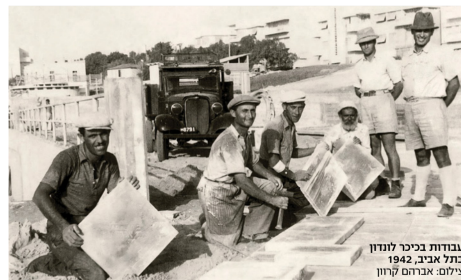
עבודות ביכיר לונדון בתל אביב, 1942

לנו מיגוניות מפורזות בשטח, ובמקרה של אועי קה העובדים נכנסים אליהן. המצב לא הפריע לנו להמשיך לעבוד. אמנם היו חסרים אנשים, אבל לא היתה ברירה והתמודדנו. האנשים רצו לנבא לעבוד, הם הגיעו ועשו' אקסטרו" כדי שהעבודה תימשך. הם גם ידעו שאנחנו תמיד עוודים בכל מה שצריך, עם מערכת תמיכה פנימית שמסיעת לכל עובד שזקוק לכך. גם מבחינת העודה לקהילה אנחנו מעורבים בהרבה מאוד מיזמים, ובמהלך