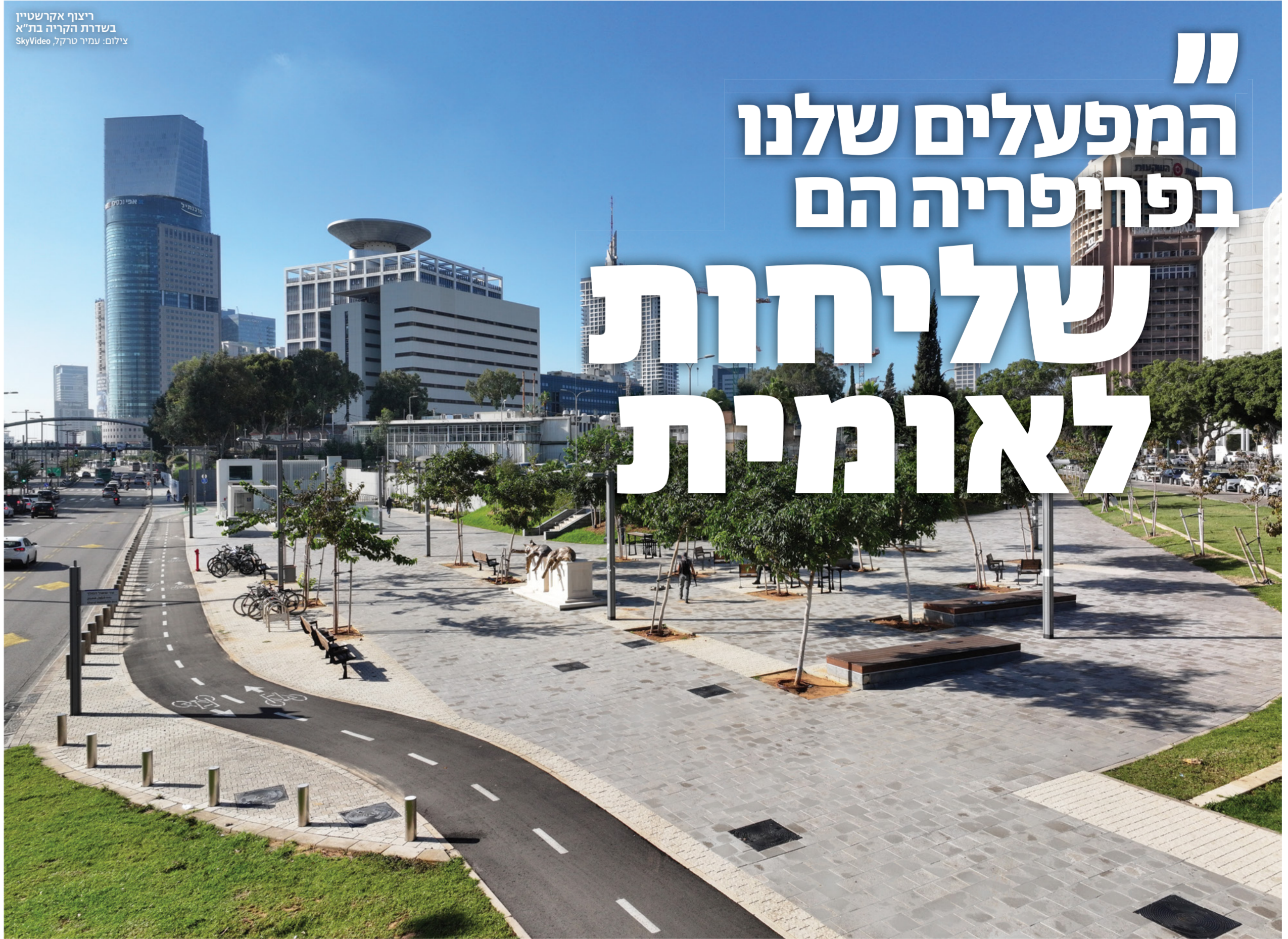
ריצוף אקרשטיין בשדרת הקריה בת"א