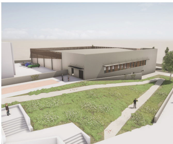
*התמונות הינן להמחשה בלבד

אקרשטיין זכינית של החברה למשק וכלכלה של השלטון המקומי, להקמת אולמות ספורט עבור הרשויות המקומיות. במסגרת המכרז חברתנו מבצעת תכנון וביצוע של סדרת אולמות התעמלות ואולמות ספורט, בשיטה מתועשת. מבנה קומפלט כולל: שלד, מערכות גמרים, שירותים, פיתוח שטח. גודל האולמות נע בין 270 מ"ר ל-1940 מ"ר.